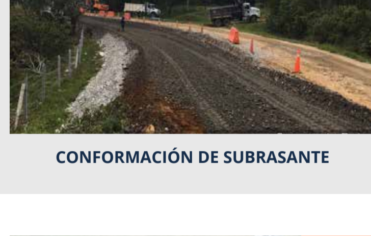
CONFORMACIÓN DE SUBRASANTE