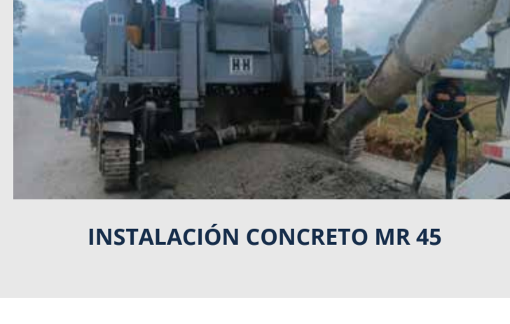
INSTALACIÓN CONCRETO MR 45