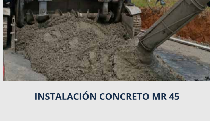
INSTALACIÓN CONCRETO MR 45