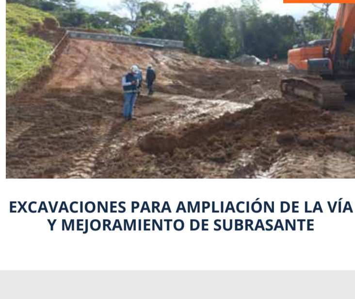
EXCAVACIONES PARA AMPLIACIÓN DE LA VÍA Y MEJORAMIENTO DE SUBRASANTE