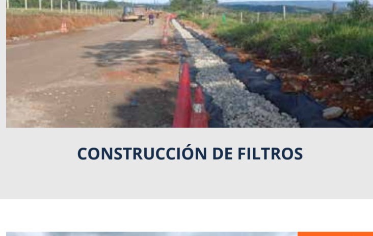
CONSTRUCCIÓN DE FILTROS