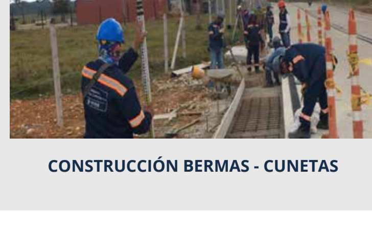
CONSTRUCCIÓN BERMAS - CUNETAS