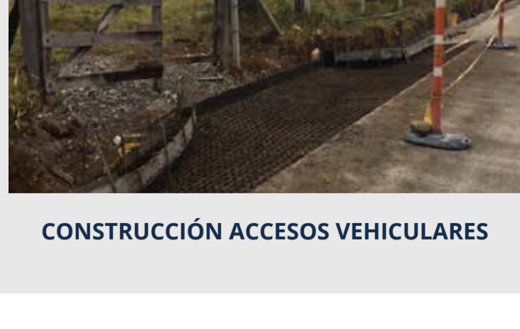
CONSTRUCCIÓN ACCESOS VEHICULARES