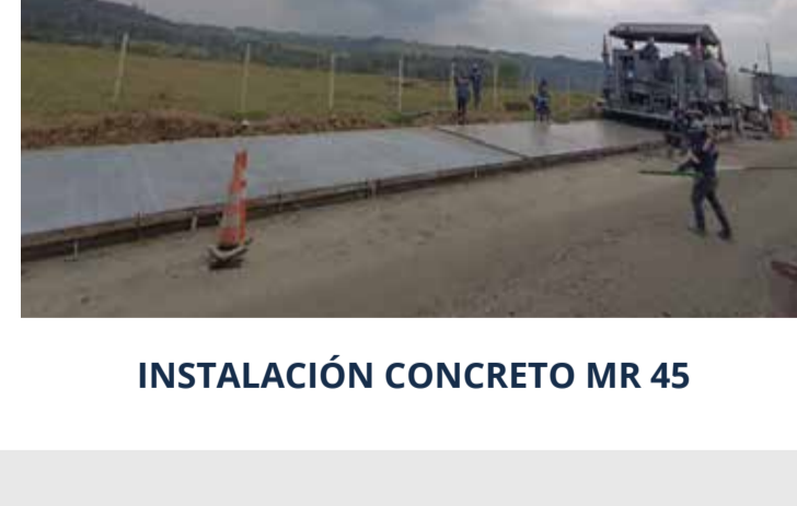
INSTALACIÓN CONCRETO MR 45