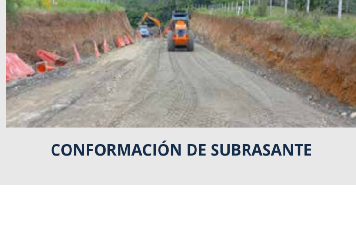
CONFORMACIÓN DE SUBRASANTE