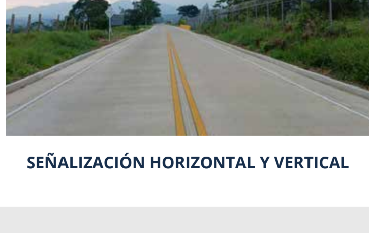
SEÑALIZACIÓN HORIZONTAL Y VERTICAL