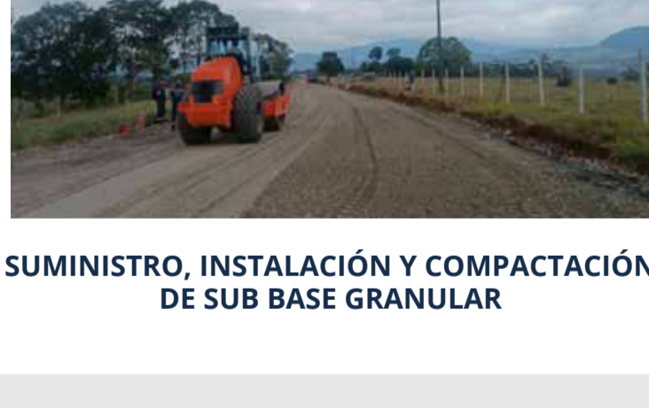
SUMINISTRO, INSTALACIÓN Y COMPACTACIÓN DE SUB BASE GRANULAR