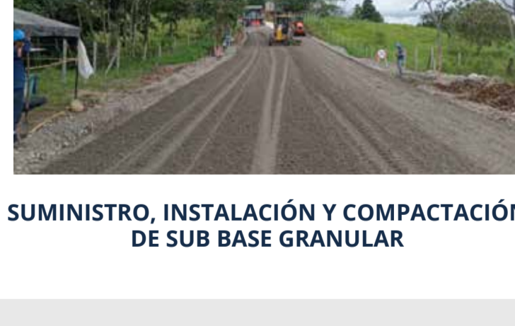
SUMINISTRO, INSTALACIÓN Y COMPACTACIÓN DE SUB BASE GRANULAR