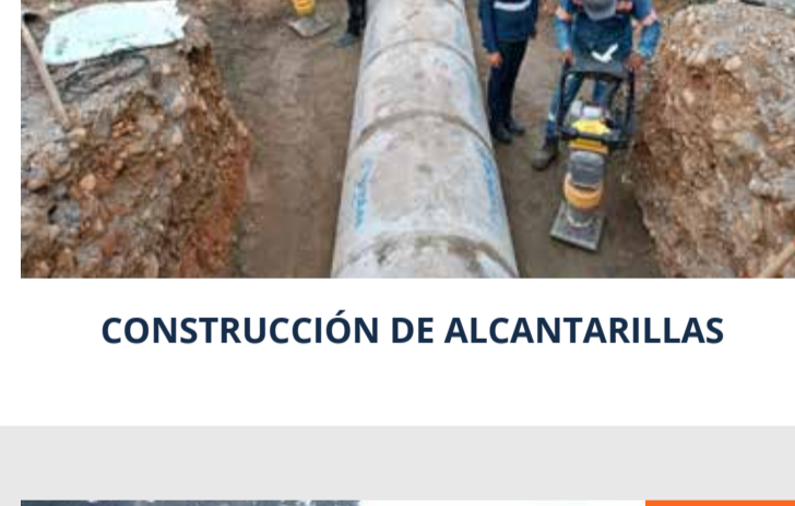
CONSTRUCCIÓN DE ALCANTARILLAS