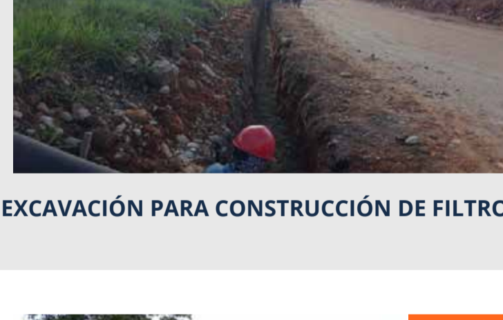
EXCAVACIÓN PARA CONSTRUCCIÓN DE FILTROS