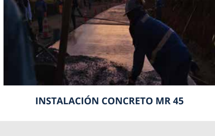
INSTALACIÓN CONCRETO MR 45