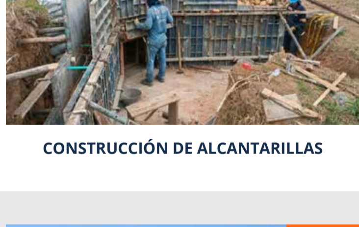
CONSTRUCCIÓN DE ALCANTARILLAS