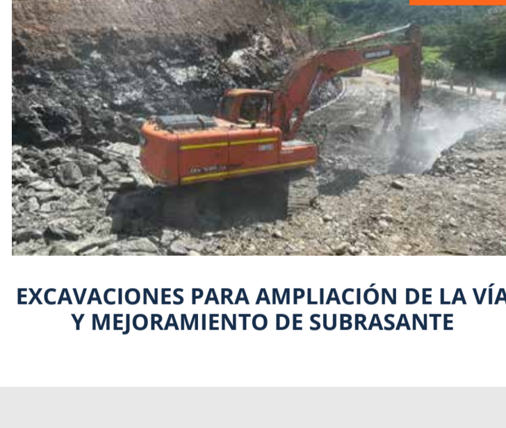
EXCAVACIONES PARA AMPLIACIÓN DE LA VÍA Y MEJORAMIENTO DE SUBRASANTE