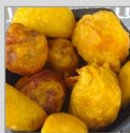
Marranitas, aborrajados y empanadas