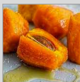
Chontaduro con miel